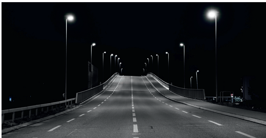
Figure 1 Route principale de Delémont.

Les données importées sont visualisées dans le logiciel basé sur des cartes. Grâce à la saisie des coordonnées géo-