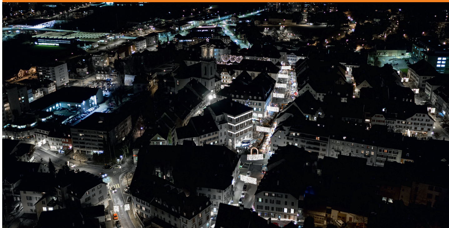
Delémont resplendit sous un nouvel éclairage.